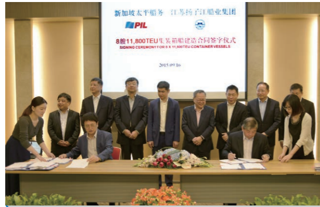
2015年9月，我公司与新加坡太平船务公司签订了12艘11800TEU集装箱船的建造合同。