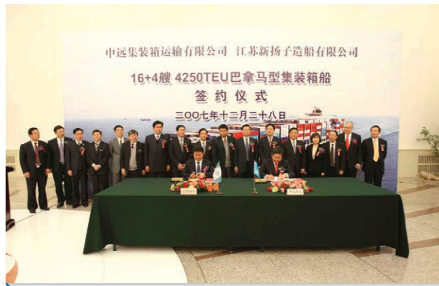
2007年12月，我公司与中远集运公司签订20艘4250TEU巴拿马型集装箱船建造合同。