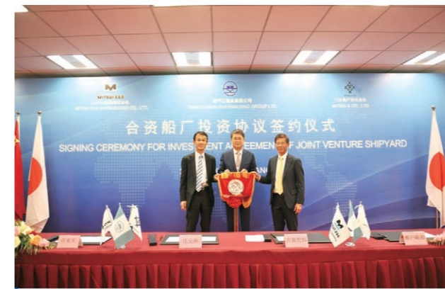
2018年10月，我公司与日本三井造船株式会社和三井物产株式会社联合签署合资船厂协议。