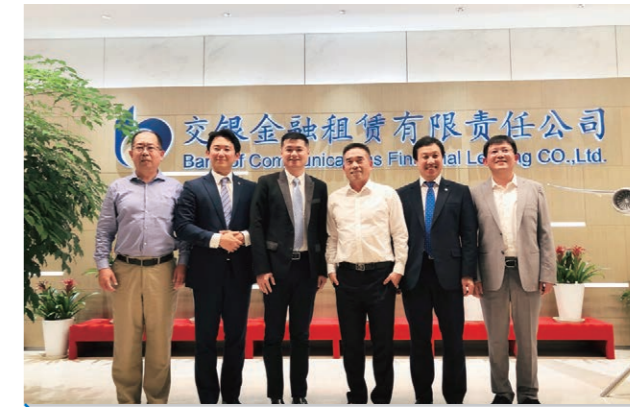
2019年8月23日，我公司与交银租赁有限公司签订了4艘325000DWT超大型矿砂船建造合同。