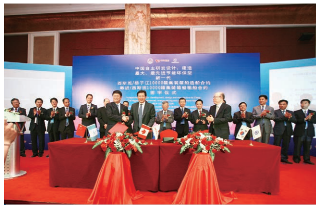
2011年6月，我公司与加拿大西班班航运公司签订25艘10000TEU集装箱船建造合同。