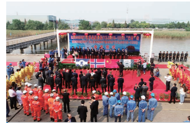
2018年10月，我公司为挪威Klaveness公司建造的全球首制83500DWT化学品组合船盛大命名。