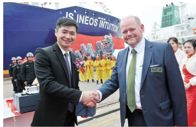
2017年3月，我公司为丹麦EVERGAS船东建造的2艘27,500m 3 液化天然气船命名交付。