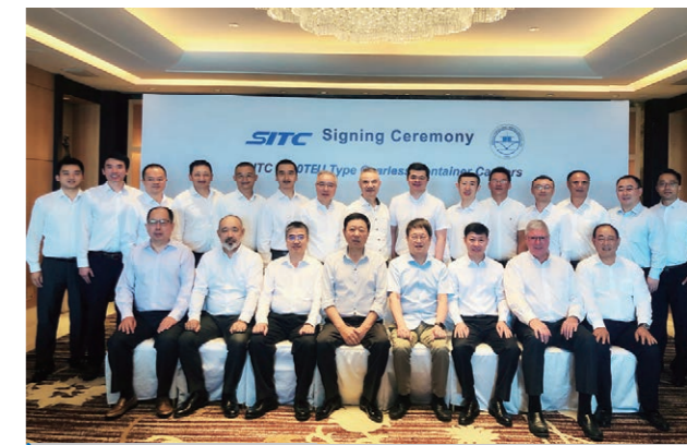
2020年8月，我公司与海丰国际签订12艘1800TEU集装箱船建造合同。