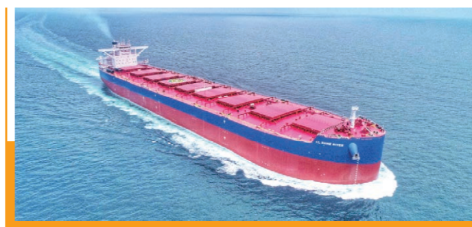
208,000DWT 纽卡斯尔型散货船