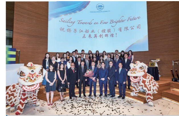
2017年4月28日，扬子江船业（控股）有限公司上市10周年庆典在新加坡证券交易所举行。