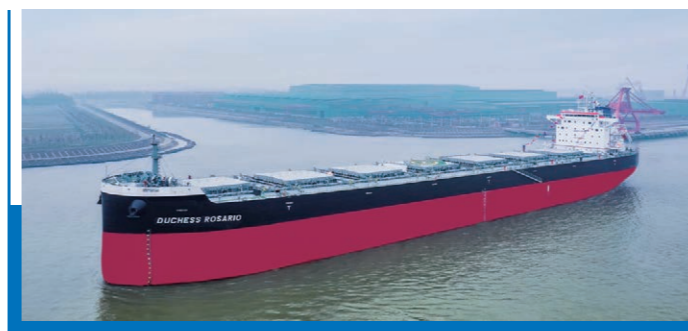
82,300DWT 卡尔萨姆型散货船