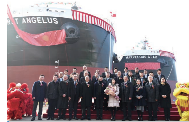
2020年1月，扬子三井造船正式运营以来首批两艘82000DWT散货船命名交付。