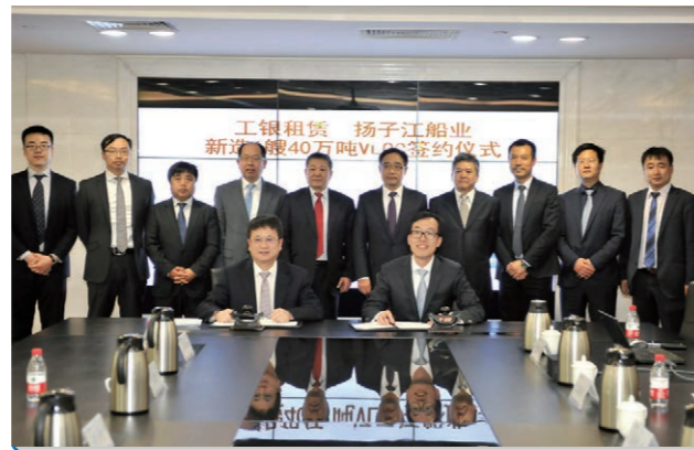
2016年4月，我公司与工商银行租赁公司（ICBC Leasing）签订了6艘400000DWT超大型矿砂船建造合同。